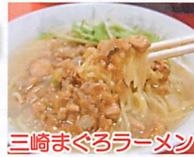
三崎まぐろラーメン