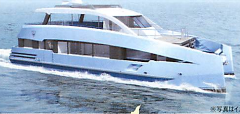
※写真はイメージです