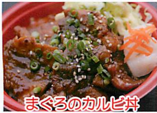
まぐろのカルピ丼