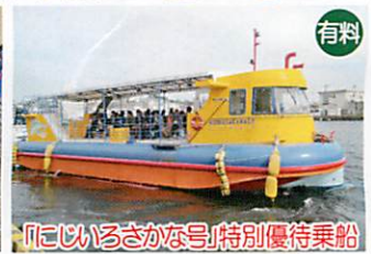
「にじいろさかな号」特別優待乗船