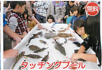
タッチングプール