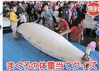
まぐろの体重当てクイズ