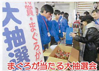
まぐろが当たる大抽選会