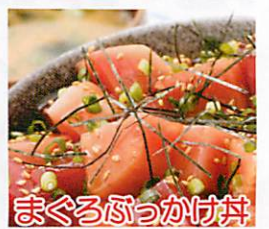
まぐろぶっかけ丼